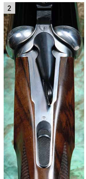
2. La codetta di bascula è di tipo tradizionale. In evidenza la chiave di apertura, la sicura a cursore e i rilievi di contorno dei seni, molto razionali e lineari.

solo a carico della zona della volata, in cui si è riscontrata la presenza di un po' di luce nei punti di contatto tra le varie componenti (canne, bindellini, blocchetto di convergenza). Manipolando l'arma in bianco, si apprezza la fluidità di rotazione della chiave, senza incagli o sgranature; il ridotto sforzo necessario per l'apertura delle canne; l'assenza praticamente totale di tolleranza tra i ramponi e le rispettive sedi, senza che questo si traduca in grattamenti o "legatura" dell'arma. Il movimento di chiusura restituisce il suono corposo e pieno dei piani che combaciano alla perfezione. Il calcio risulta perfettamente allinea-