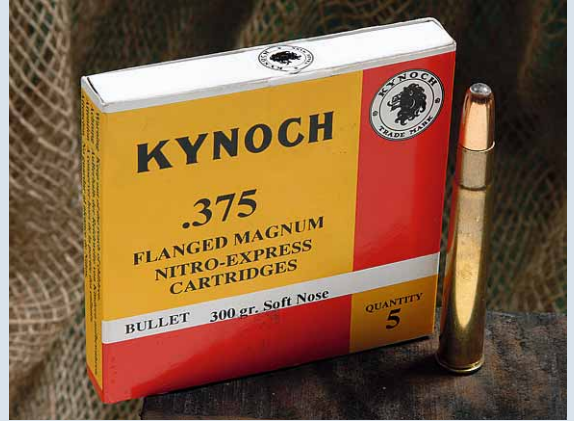
La convergenza è stata effettuata con cartucce Kynoch con palla di 300 grani.

sulla precisione di piazzamento del colpo, che anche e soprattutto sulle prede da safari, è tutto! Queste "doti nascoste" sono state per lungo tempo dimenticate e, infatti, molti produttori di express sono passati a offrire direttamente il .375 H&H tra le camerature disponibili, pagando però talvolta lo scotto di una minore efficienza di estrazione dei bossoli, vista la conformazione del fondello (che richiede alcuni accorgimenti, come il dente elastico di tenuta incorporato nell'estrattore, più delicato