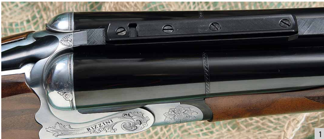
1. All'estremità posteriore della bindella c'è la slitta a coda di rondine per l'installazione di ottiche di puntamento.

rispetto all'estrattore convenzionale massiccio). Oggi, invece, si sta assistendo a una nuova giovinezza per questa cartuccia, tanto è vero che oltre ai produttori tradizionali, come Kynoch e Wolfgang Romye, anche Norma ha deciso di proporre la Flanged nella sua recente gamma African Ph. I caricamenti, generalmente, partono da un minimo di 235 grani e arrivano fino a un massimo di 300, con palla Fmj (per le prede a pelle più spessa e di maggior mole) oppure Soft point (o, all'inglese, Soft nose ). (R.P.)