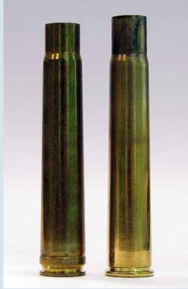
Il .375 Flanged (a destra) a confronto con il .375 Holland & Holland magnum. La differenza è principalmente a carico del fondello.